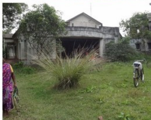
Foto's van het Bolpur centrum uit 2012

Alweer drie jaar geleden bezochten we in Bolpur, een stad ten noorden van Calcutta, waar het RCFC een 'dependance' heeft. Elke week kwam hier een fysiotherapeut langs om kinderen te checken die geopereerd waren en nieuwe potentiële patiënten te onderzoeken.